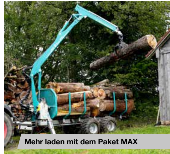
Mehr laden mit dem Paket MAX