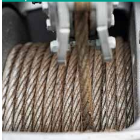
PTB | Pfanzelt Trommelnachlaufbremse

Einzigartig am Markt ist die Trommelnachlaufbremse PTB . Wird ein unter Spannung stehendes Seil gelöst, sorgt das für Unordnung auf der Seiltrommel. Die Trommelnachlaufbremse PTB brems in solchen Fällen automatisiert die Trommel und sorgt so für eine saubere Seilwicklung. Ein leichter und unproblematischer Seilauszug wird so ermöglicht.